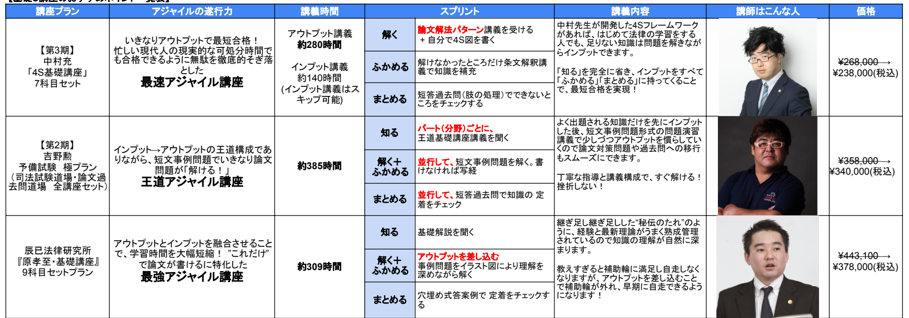
【基礎3講座のおすすめポイント一覧表】